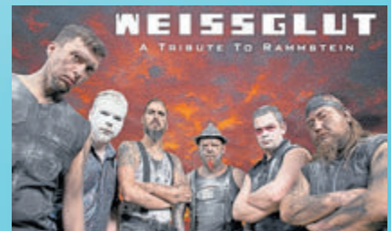
Weissglut – A Tribute to Rammstein, 8.2., Zollern-Alb-Halle Tailfingen Für Abonnenten 30,90 € statt 34,20 €