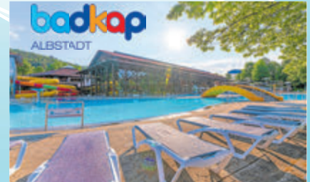
Badkap Tageskarte 4h-Karte Erw./Kinder, täglich, A.-Ebingen Für Abonnenten 8,40 – 13,20 € statt 9,90 – 15,90 €