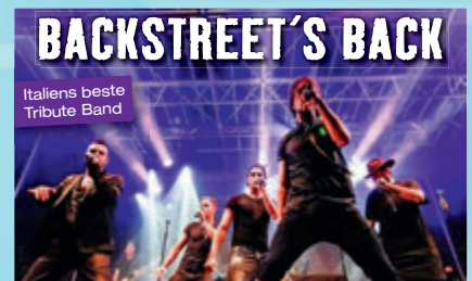
Backstreet's Back, 28.3., Festhalle Ebingen Für Abonnenten 24,30 € statt 26,50 €