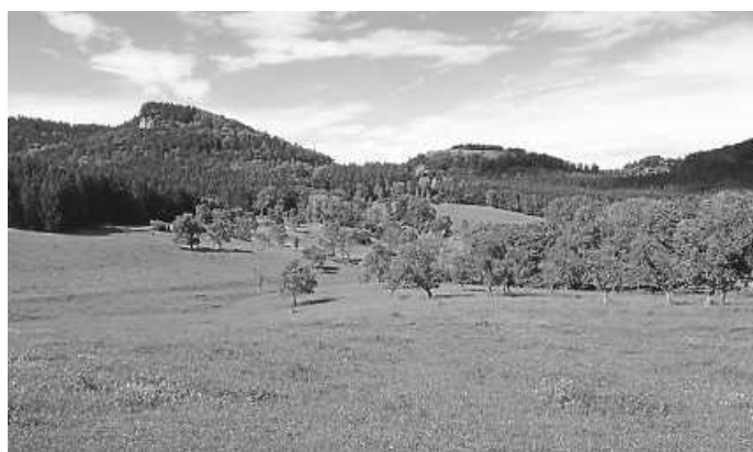
Der Sportverein wünscht viel Spaß beim Ausprobieren!