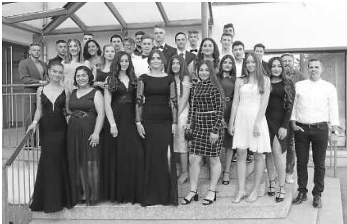
Klasse 9a und 9b