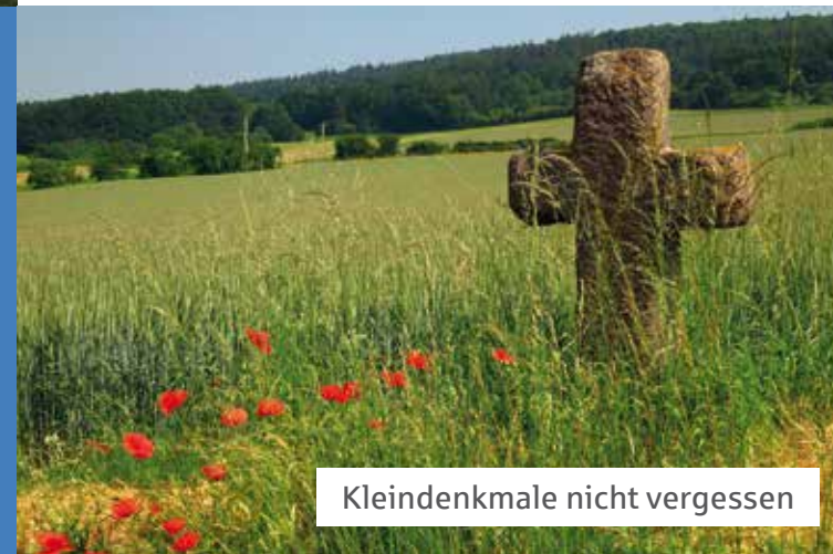
Kleindenkmale nicht vergessen

Angesprochen ist, wer sich um Kleindenkmale kümmert, wer sie schützt, renoviert und pflegt, wer eines vor dem Untergang rettet, wer sich ihrer Kulturge-