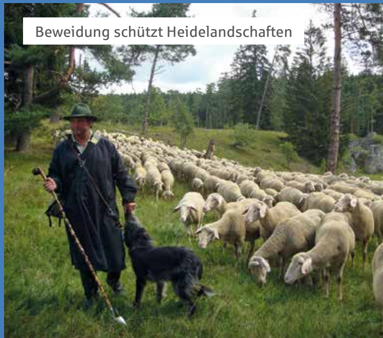
Beweidung schützt Heidelandschaften