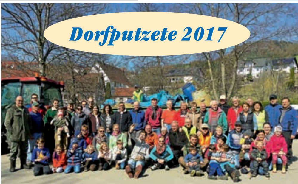
Unser Bild zeigt die Helfer der Dorfputzete.

Überwältigend war die Beteiligung bei der Dorfputzete. Rund 60 Personen halfen tatkräftig mit und so konnten alle geplanten Strecken auch tatsächlich gereinigt und insgesamt von etwa einer Tonne Müll befreit werden. Herzlichen Dank allen Einwohnern für Ihren Einsatz am Samstagmorgen.